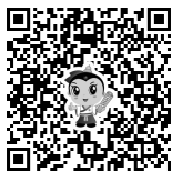
配套名师高清视频