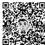
人机对话模拟测试

操作提示部分位于屏幕下方,提示考试剩余时间、题量、当前答题进度,采用两条移动线条的形式,一条表示答题进度(答题进度条),另一条表示时间进度(时间进度条)。通过比较两者长短或完成百分率,形象地反映答题与时间使用的情况,在实际考试中注意两线的进展速度,若时间进度条的进展速度快于答题进度条时反映考生的答题速度较慢。